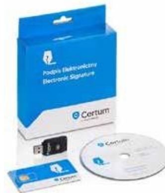
Zestaw cryptoCertum MINI z czytnikiem USB