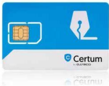
Zestaw cryptoCertum MINI bez czytnika

Karta Certum jest wymieniona na stronie www.cepik.gov.pl jako spełniająca wymagania techniczne.